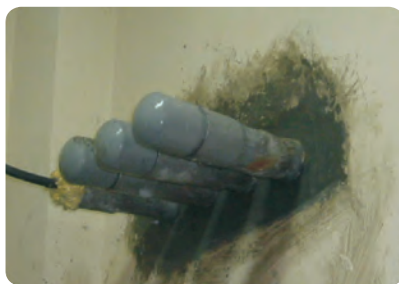
管邊孔隙滲水填補