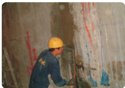
外牆連續壁包泥處理