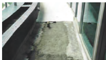
塗佈滲透結晶防水劑